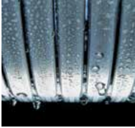
Inox-Radial-warmtewisselaar— duurzaam en efficiënt