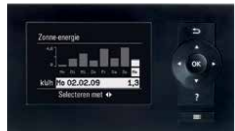
Het grafische display van de Vitotronic-regeling kan bv. ook het zonnerendement weergeven

De Vitodens 242-F is in alle vermogenscategorieën uitgerust met de automatische verbrandingsregeling Lambda Pro Control. Ook bij een schommeling van de gassamenstelling blijft het rendement continu hoog. Zelfs bij verandering van het soort gas - bijvoorbeeld door toevoeging van biogas - moet de sproeier niet vervangen worden. De Lambda Pro Control verbrandingsregeling zorgt ervoor dat het toestel automatisch wordt aangepast aan de nieuwe omstandigheden.