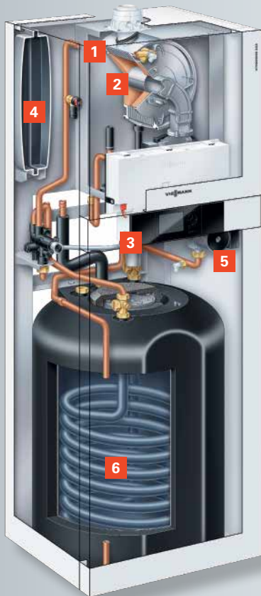
Vitodens 222-F met geëmailleerde spiraal-warmwaterboiler (type B2SA) voor gebieden met een hoge waterhardheid