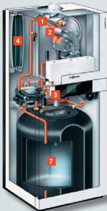
Vitodens 222-F met geëmailleerde laadboiler (type B2TA)