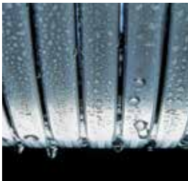
Inox-Radial-warmtewisselaar- duurzaam en efficiënt