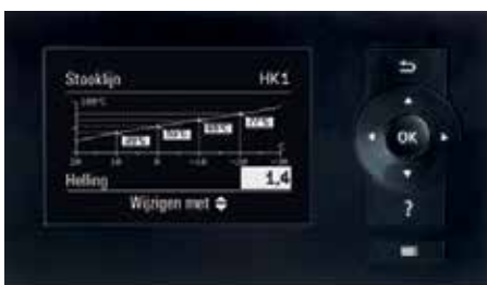
Vitotronic regeling – eenvoudige bediening dankzij menage-stuurde instructies en grafisch display, bv. voor weergave van de stooklijnen